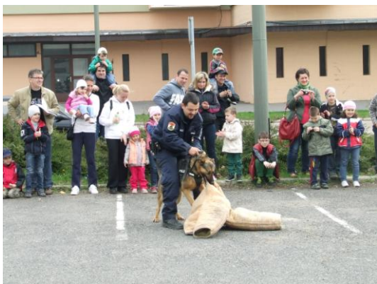
3) NEFU nevű szolgálati kutya bemutatója

A tavalyi év beszámolójához tartozik, hogy hosszú évek hiányát pótolva 2012-ben kutyás járőrszolgálatot is tudtunk vezényelni a városban!