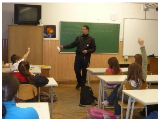
7) munkában az iskola rendőre - Padragkúton

A 2012/2013-as tanév megkezdése előtt felvettük a kapcsolatot az illetékes oktatási intézmények vezetőivel és tájékoztatták őket „ az iskola rendőre ” program folytatásáról. Az összes iskolához tartozik „iskola rendőre”.