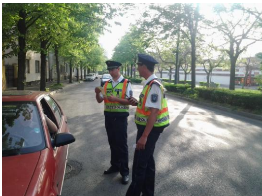
4) gépjárművezető ellenőrzése

Fokozott közbiztonsági-bűnügyi ellenőrzést/akciót 256 esetben 1046 fő részvételével, 432 rendőri intézkedéssel, míg fokozott közlekedésbiztonsági akciót 49 esetben 239 fő részvételével, 452 rendőri intézkedéssel tartottunk.