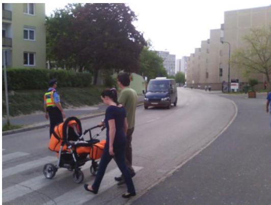
2) gyalogos járőrszolgálat a Kossuth utcában

Erősítettük a gyalogos szolgálatellátást, így a rendezvények idején, a pénzintézetek, a piac, a bevásárló helyek környékén, a vasútállomáson, a buszpályaudvaron, a lakótelepeken, a Csónakázó-tó mellett számíthatnak az állampolgárok gyalogos rendőrök megjelenésére, de a helyi buszjáratokon is feltűnnek az egyenruhások.