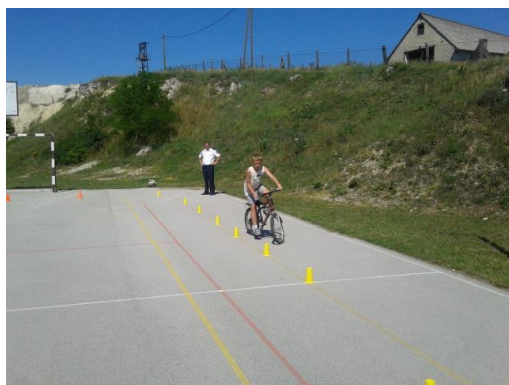
6) kerékpáros ügyességi verseny gyermekeknek, Superbringa program keretében

2012-ben is folytattuk a „ Szuperbringa ” programot, amelynek keretében gyermekek kerékpárjainak felszereltségét és műszaki állapotát ellenőriztük.