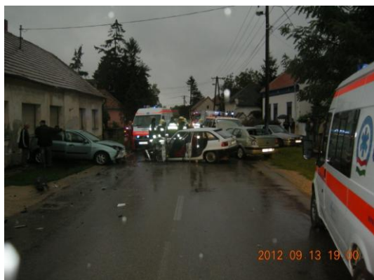
5) személyi sérüléssel járó baleset helyszíne

A halálos balesetek száma 3-ról 1-re csökkent, míg 1-el több súlyos és 4-el kevesebb könnyű sérüléssel járó baleset következett be, mint tavaly.